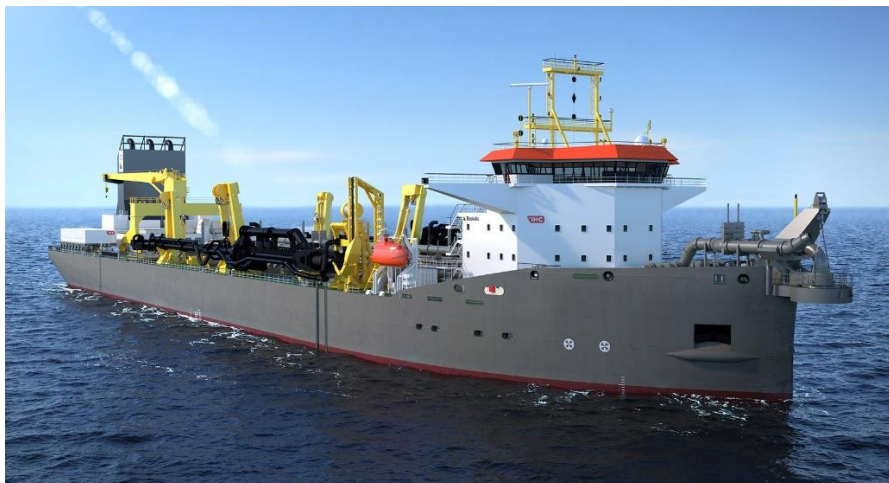
Artist's impression van de nieuwe Boskalis sleephopperzuiger

Boskalis heeft met de Nederlandse scheepsbouwer Royal IHC een contract getekend voor de bouw van een grote ultramoderne sleephopperzuiger. De gunning van het contract volgt op een uitvoerige ontwerpfase. Het schip krijgt een beuncapaciteit van 31.000 m 3 en wordt de komende jaren op de IHC werf in Krimpen aan den IJssel gebouwd.